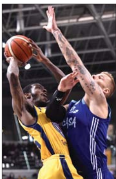
Torino-Brindisi