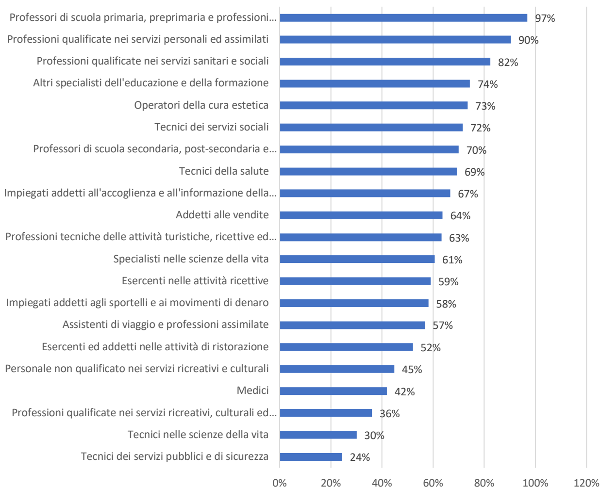
Fig. 2 – Incidenza delle donne sul totale degli occupati in professioni ad alto e molto alto rischio contagio (val. %)