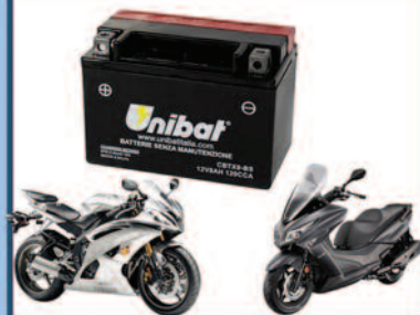
Batterie Moto e Servizi