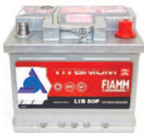
Batterie Auto e Veicoli Commerciali