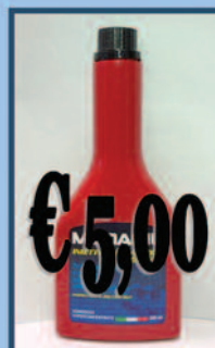
Additivo Diesel Pulizia iniettori