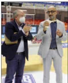
Il sindaco e il coach

Nella stessa serata di lunedì 7 giugno sono stati ufficializzati i premi