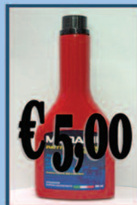
Additivo Diesel Pulizia iniettori

Aloisio Ricambi - Via Appia, 234 - 72100 - Brindisi Tel. 0831/582133 - Sito www.aloisioricambi.it