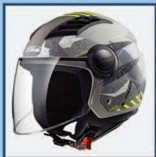
Caschi Jet da €35,00