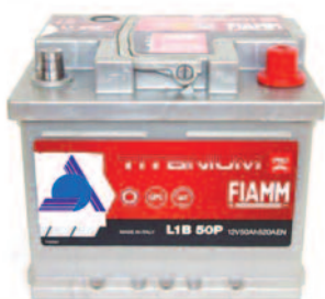
Batterie Auto e Veicoli Commerciali