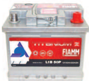
Batterie Auto e Veicoli Commerciali