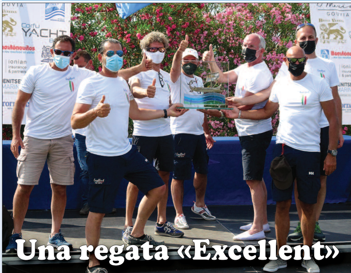
L'equipaggio di «Excellent» sul palco del Marina di Gouvia