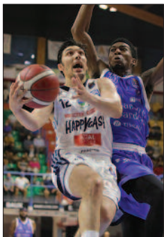
Brindisi-Sassari