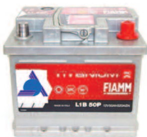
Batterie Auto e Veicoli Commerciali