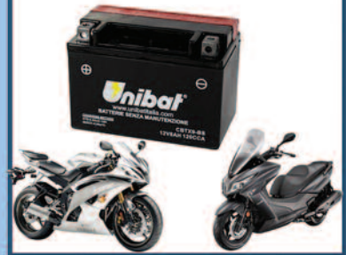
Batterie Moto e Servizi