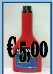
Additivo Diesel Pulizia iniettori

Aloisio Ricambi - Via Appia, 234 - 72100 - Brindisi Tel. 0831/582133 - Sito www.aloisioricambi.it