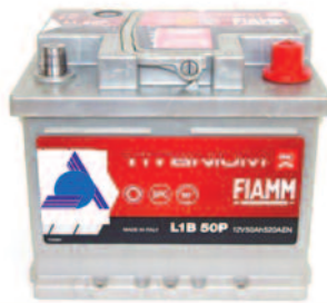
Batterie Auto e Veicoli Commerciali