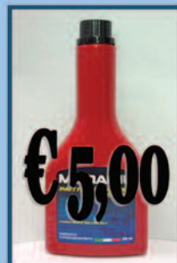
Additivo Diesel Pulizia iniettori

Aloisio Ricambi - Via Appia, 234 - 72100 - Brindisi Tel. 0831/582133 - Sito www.aloisioricambi.it