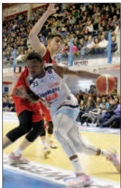
Brindisi-Varese