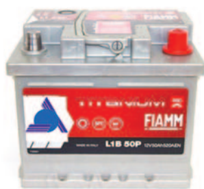
Batterie Auto e Veicoli Commerciali