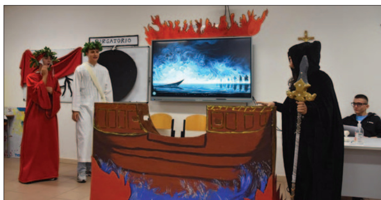
Liceo Scientifico «Leo» San Vito dei Normanni, 6 dicembre 2024: «Notte di Prometeo»