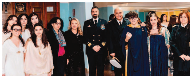
Liceo Classico «Marzolla» Brindisi, 13 dicembre 2024: Notte Bianca «Se amo, ricordo»