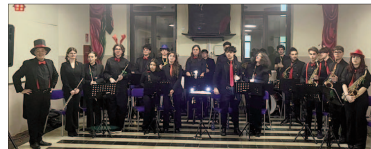
Liceo Artistico Musicale «Simone-Durano» Brindisi, 20 dicembre 2024: «Notte delle Muse»