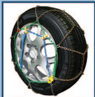
Catene da Neve