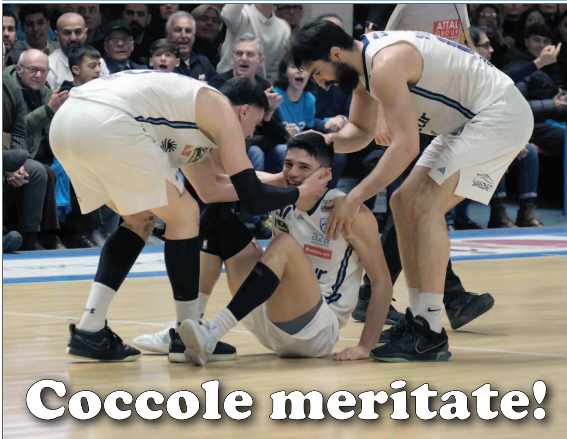
Brindisi-Bologna 73-69: la gioia dei giocatori della Valtur

BRINDISI BATTE BOLOGNA. CALZAVARA SEGNA LA TRIPLA DECISIVA