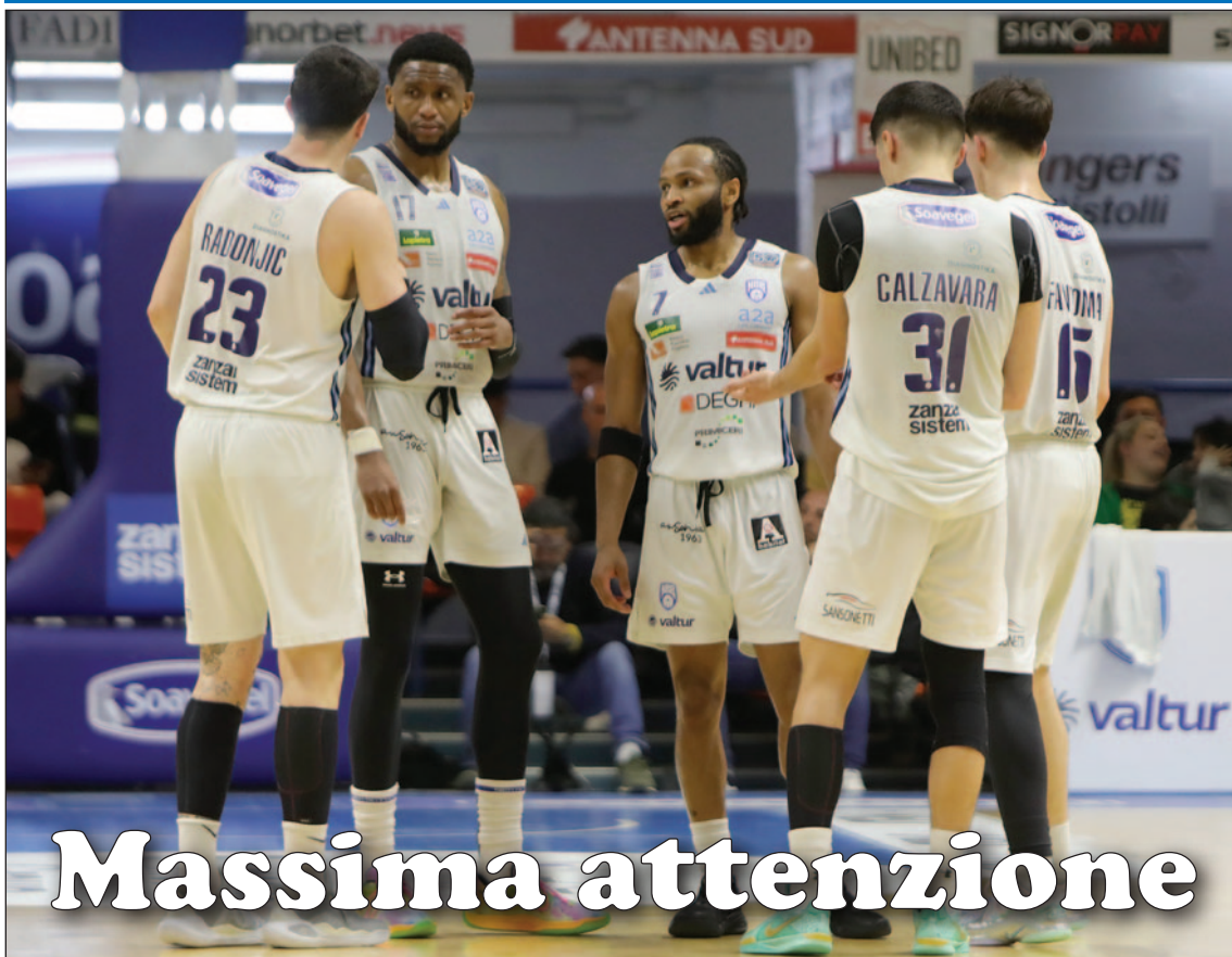
Un quintetto Valtur schierato contro Cremona

CON CANTÙ E CIVIDALE UN DECISIVO DOPPIO CONFRONTO INTERNO