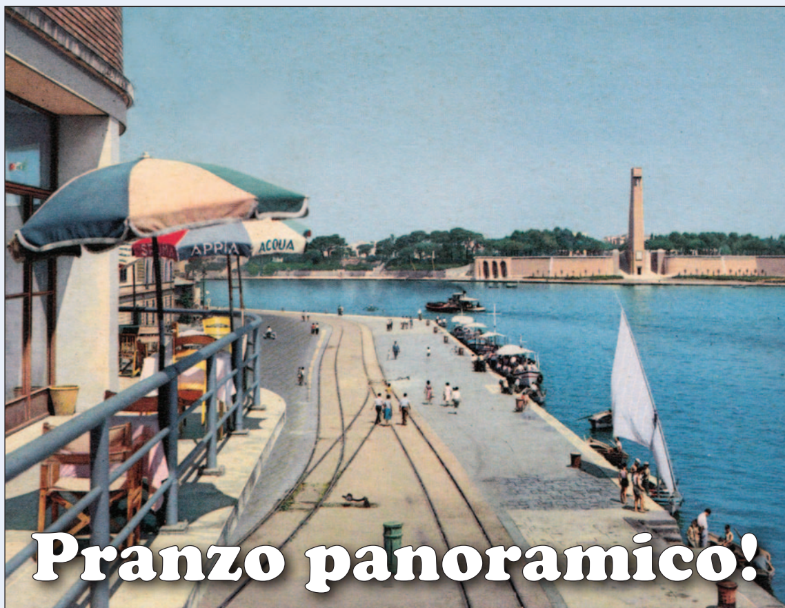
Una vecchia cartolina della stazione marittima e del porto di Brindisi

QUANDO LA SEDE DELL'AUTORITÀ PORTUALE ERA UN RISTORANTE