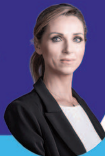
TESTIMONIAL VALENTINA VEZZALI