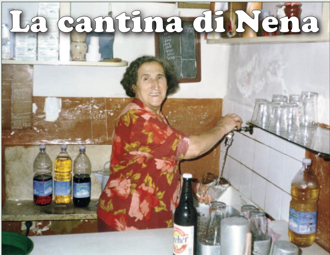
La cantina di Nena in via Bari negli anni Sessanta - Servizio di Roberto Romeo a pagina 5

BASKET: VALTUR, QUINTA VITTORIA - CALCIO: BRINDISI LEADER