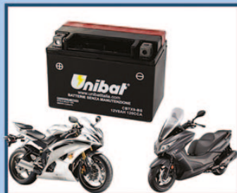
Batterie Moto e Servizi