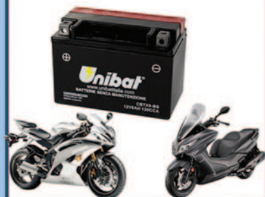
Batterie Moto e Servizi